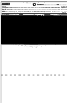
Form 1B 194 x 289 mm

I cartoncini Penopac ( penetration opacity ) sono prodotti di uso universale in quanto combinano aree di prova per penetrazione (quindi prive di vernice trasparente) e di opacità. Vengono usate per funzioni di ricerca e sviluppo e per controllo qualità. La zona nera è sempre protetta con vernice trasparente tranne che per il tipo 19BR che è protetta/non protetta.