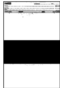
Form 19BR 194 x 289 mm