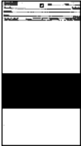
Form 1A 140 x 254 mm