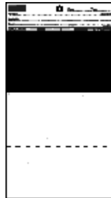
Form 18A 140 x 254 mm

I cartoncini Penopac ( penetration opacity ) sono prodotti di uso universale in quanto combinano aree di prova per penetrazione (quindi prive di vernice trasparente) e di opacità. Vengono usate per funzioni di ricerca e sviluppo e per controllo qualità. La zona nera è sempre protetta con vernice trasparente tranne che per il tipo 19BR che è protetta/non protetta.